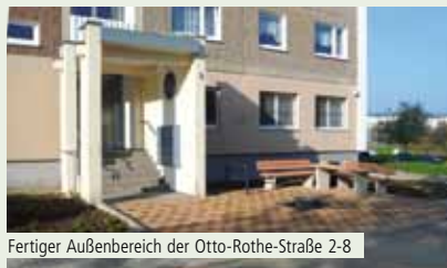
Fertiger Außenbereich der Otto-Rothe-Straße 2-8

Im Oktober konnten die Außenarbeiten zur Neugestaltung der Hausingangsseite der Otto-Rothe-Straße 2-8 abgeschlossen werden. Auch in der Nordstraße 24-28 wurden die Fassadenarbeiten im Herbst beendet, sodass der Block wieder mit neuem Anstrich glänzt. Einzig die Malerarbeiten in den Treppenhäusern der Arminiusstraße 10-14 befinden sich noch in den letzten Zügen, sodass somit alle größeren Bauvorhaben in diesem Jahr planmäßig zu Ende gebracht werden konnten.