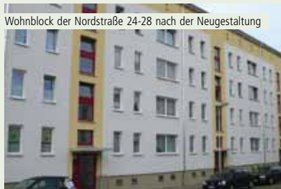
Wohnblock der Nordstraße 24-28 nach der Neugestaltung

Mit welchen Bauvorhaben es im nächsten Jahr weiter geht, zeigt die nachfolgende Abbildung: