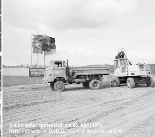
Symbolischer Spatenstich am 28. April 1972