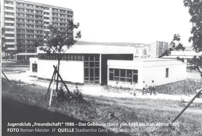
Jugendclub „Freundschaft“ 1986 – Das Gebäude stand von 1985 bis zum Abriss 1995 FOTO Roman Meister // QUELLE Stadtarchiv Gera, TAG Wohnen & Service GmbH