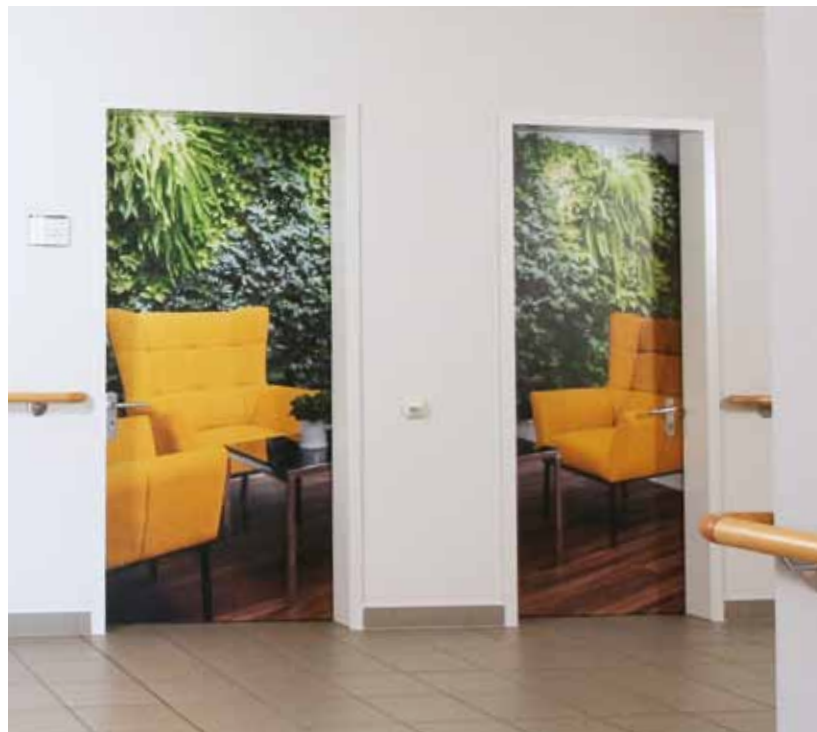
Tür zum Fahrradraum im Erdgeschoss als neuer Blickfang