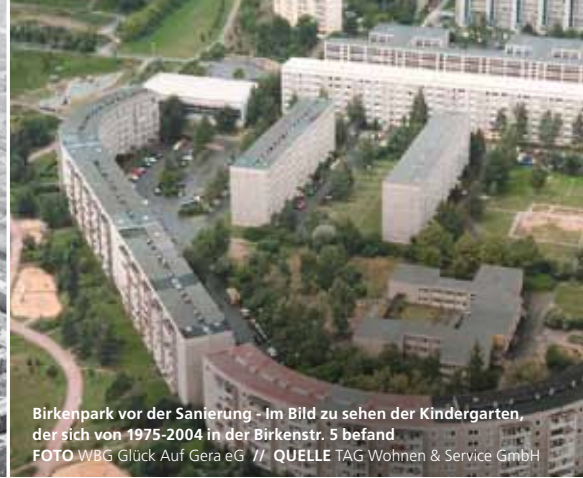
Birkenpark vor der Sanierung - Im Bild zu sehen der Kindergarten, der sich von 1975-2004 in der Birkenstr. 5 befand