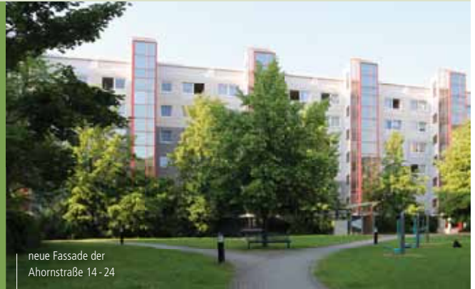
neue Fassade der Ahornstraße 14-24

In der Jenaer Straße 7-17 kommt die Elektrosanierung weiter gut voran. Damit verbunden wurden bisher die Keller und Treppenhäuser gemalt und neue Kellerboxen angelegt. Bis Ende Juni sollten die Arbeiten beendet sein. Des Weiteren werden zurzeit an allen Wohnungseingangstüren der Jenaer Straße 1-37 Oberflächenschleier angebaut. Diese Arbeiten laufen voraussichtlich noch bis zum August.